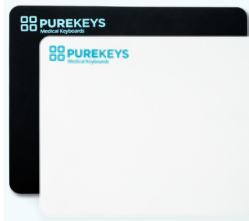
40010 weiß / 40015 schwarz